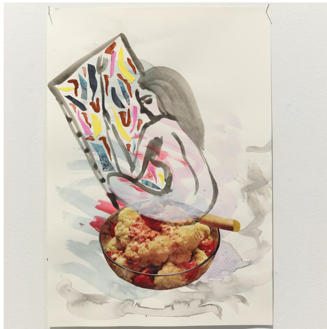
Teos sarjasta Mankeloitu nainen , 2024