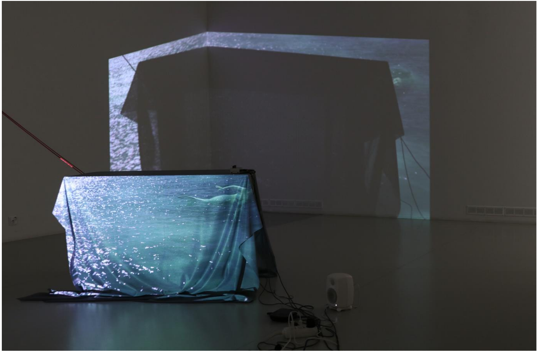
Mia Rinne: River Eye , 2025 (installation)