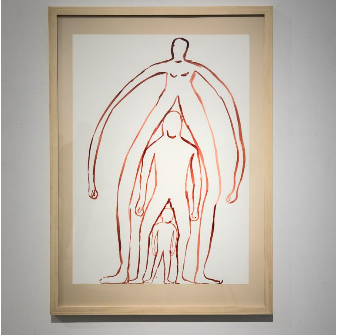
Mirka Raito: Construction , 2024